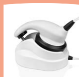
MB 11 BERAprhone mit Hörerablage

Im Interesse des technischen Fortschritts behalten wir uns Änderungen vor.