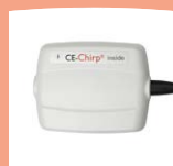
MB 11 Box